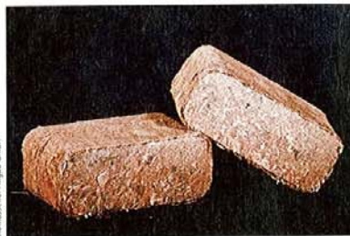
Brennstoffe Alga, GmbH

M it Anheizen oder Holznachlegen haben Besitzer von Pelletöfen keine Sorgen. Anders die echten Scheitholzfans: Bei den ersten morgendlichen Schritten ins kalte Zimmer denken sie hin und wieder wohl doch etwas neidisch an die selbstzündenden Pelletöfen. Und auch das Schleppen von Holz zum Ofen macht Arbeit und Dreck.