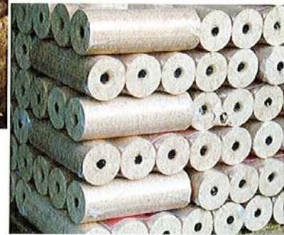
Holz-Energie-Zentrum Olsberg GmbH

Einer der Vorteile von Holzbriketts ist die unkomplizierte Lagerung. Sie werden in handlichen Paketen geliefert und können platzsparend aufgestapelt werden.