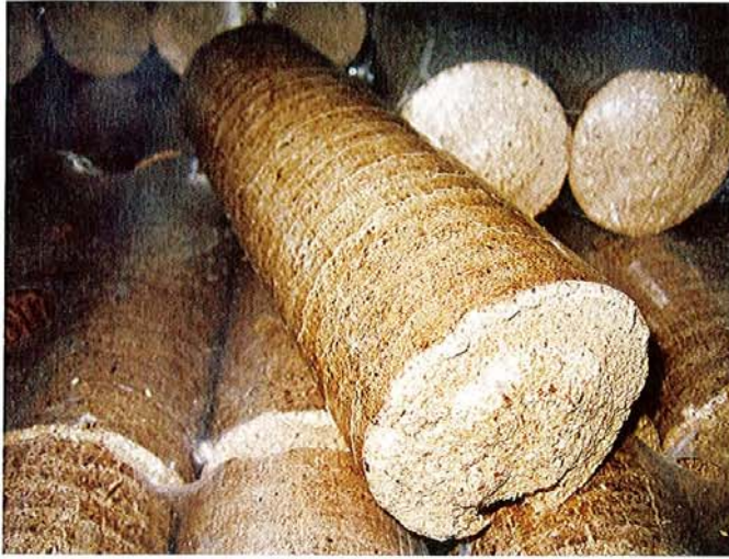
Holz-Energie-Zentrum Olsberg GmbH